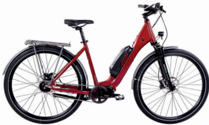
mit Federgabel, 28" x 2,0" Reifen & 53 mm Schutzblechen