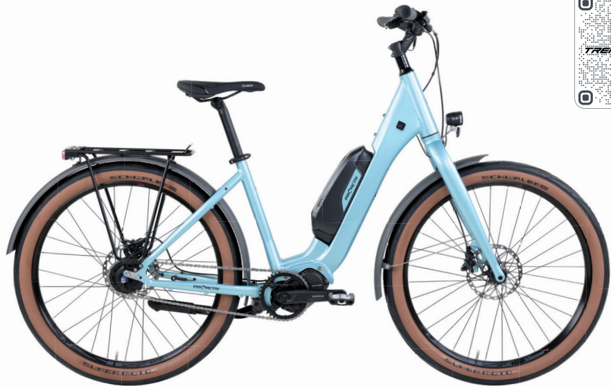
mit starrer Gabel, 27,5" x 2,4" Reifen & 68 mm Schutzblechen